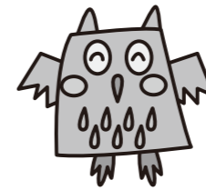
「道民家庭の日」 イメージキャラクター ぼーぼーくん

公益財団法人 北海道青少年育成協会 〒060-0005 札幌市中央区北5条西6丁目 第二道通ビル6階 TEL. (011) 231-6451 FAX. (011) 231-6457 ホームページ: http://www.ikuseikyokyo.jp/ facebook: https://www.facebook.com/ikuseikyokyo Eメール: youth@ikuseikyokyo.jp