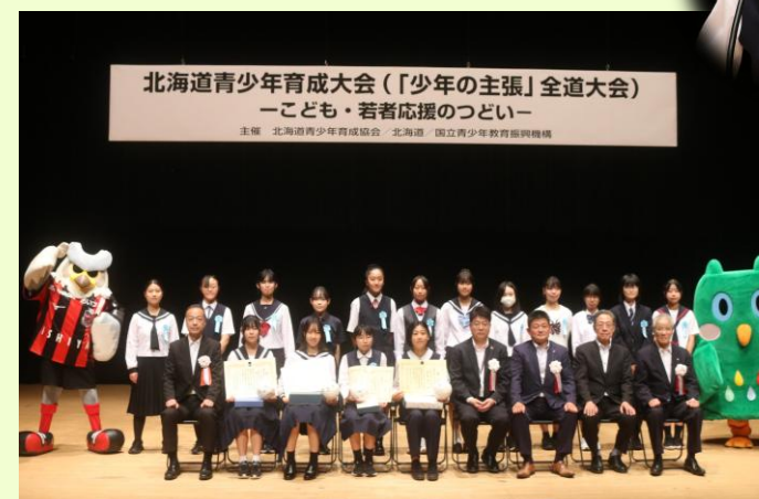
北海道青少年育成大会 「少年の主張」全道大会 令和7年8月30日(金) 札幌市/かでる2・7