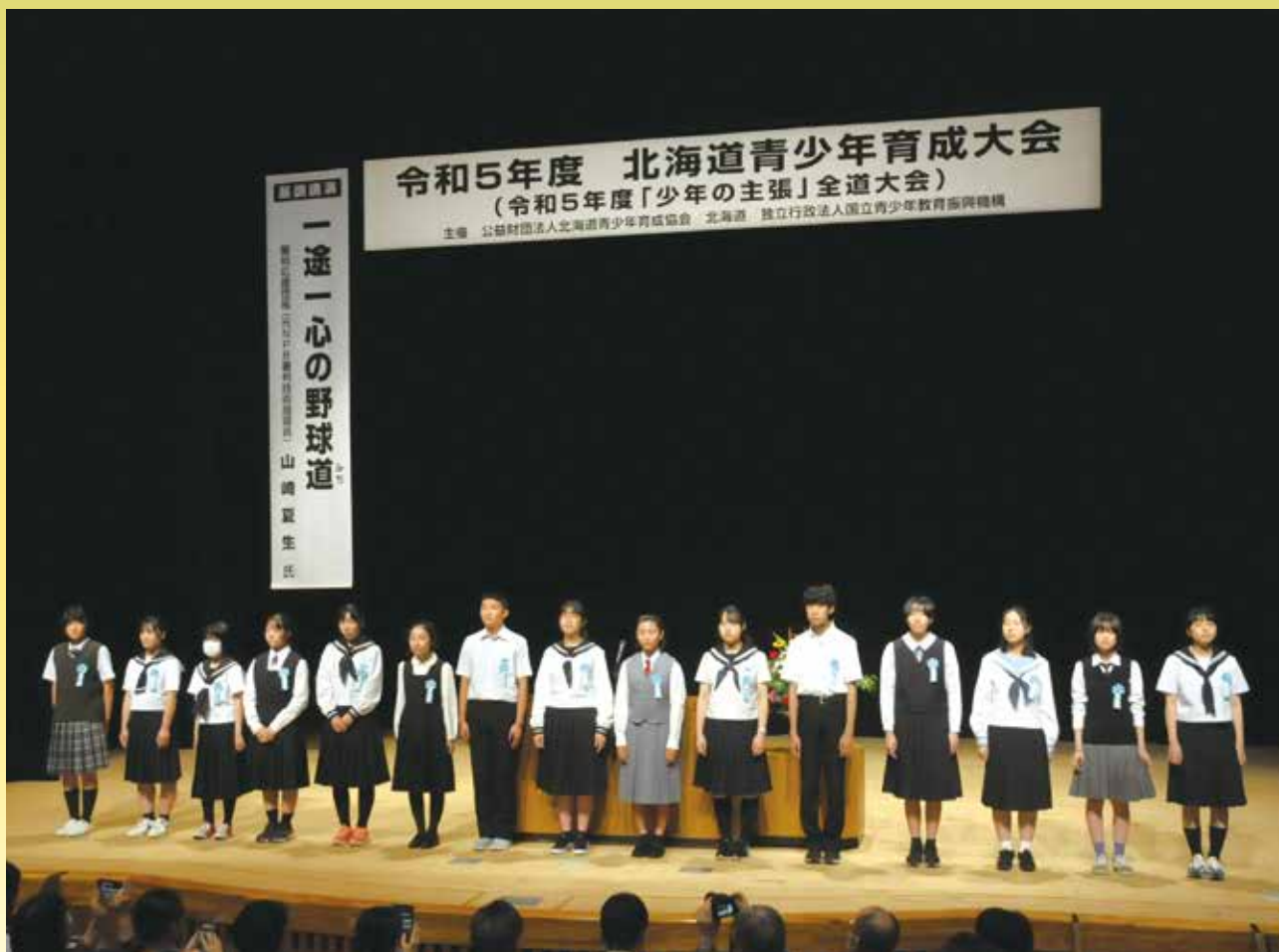
令和5年度「少年の主張」全道大会を4年ぶりに会場で開催(3ページ参照)