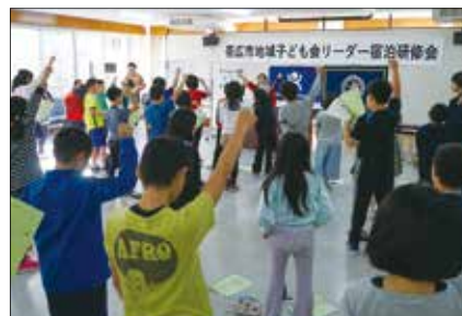
地域子ども会リーダー宿泊研修会