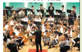
台湾との交流演奏会