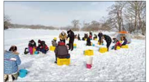
三世代わかさぎ釣り体験（北斗市）