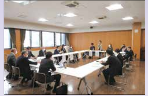
青少年育成地域合同会議（檜山）

令和5年度は、5月15日の檜山振興局を皮切りに約2ヶ月間にわたり開催しました。会議では、北海道（振興局）、北海道教育委員会（教育局）、当協会からそれぞれ説明し、北海道警察から青少年の非行状況について情報提供を頂きました。その後の意見交換では、地域で活動する青少年育成推進指導員から、昨年度の活動状況を中心に報告があり、「コロナ禍でできなかった事業を復活した」「縮小して実施した」「新しい取り組みを行った」などのお話がありました。今回は、その一部をご紹介します。