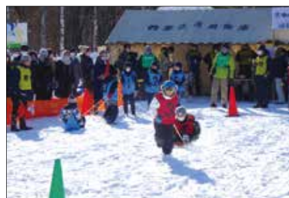
十勝子ども雪上ばんば