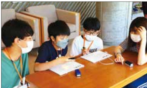
北海道教育大生と小学生との交流（猿払村）