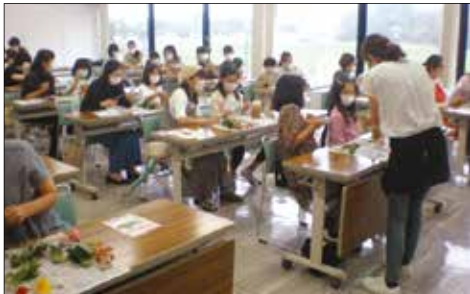
フラワーアレンジメント教室（伊達市）