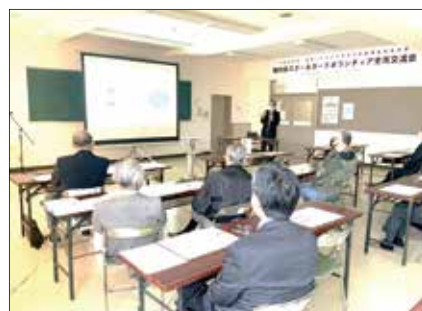
スクールガードボランティア全市交流会