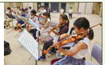
バイオリンの練習

「地方から文化の発信」を大切に、各地での活動を継続し、文化を根付かせ、ジュニアオーケストラがさらに発展すること、各都市でまちづくり、国際貢献、文化振興活動の一助となることを目標に取り組んでいます。