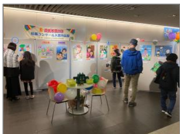
▲絵画コンクール入賞作品展(チカホ)