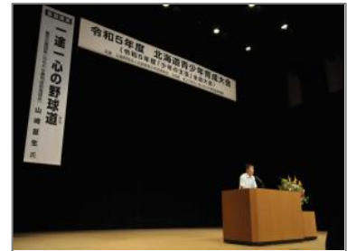
▲北海道青少年育成大会での「少年の主張」全道大会