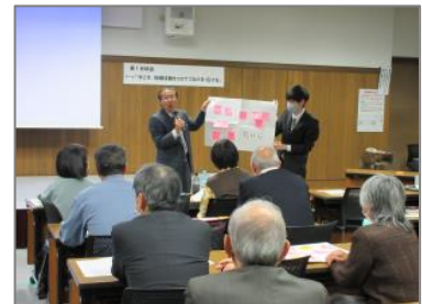
▲活性化研究協議会 分科会