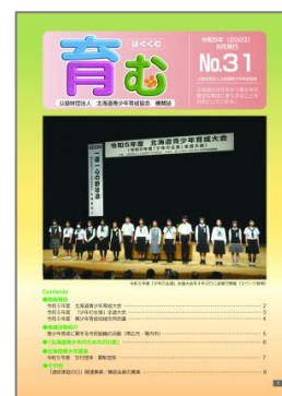
▲機関誌「育む」の発行