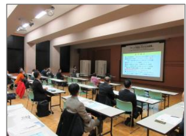
▲地域懇話会での講話(新十津川町)