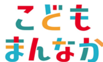
▲「こどもまんなか」マーク

また、「全国青少年育成県民会議連合会」の一員として、他県民会議と情報交換や連携することで幅広い活動を推進する。