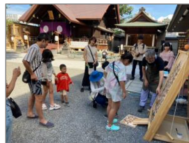
▲地域交流・市街地活性化を進める活動

青年団体・グループが行う青年の社会参加を促進する活動、地域の安全・安心を高める活動、子どもの体験活動を広げる活動、障害者や高齢者などの生活支援を進める活動、地域おこしを進める活動等に対し、助成金を交付する。(4件予定)