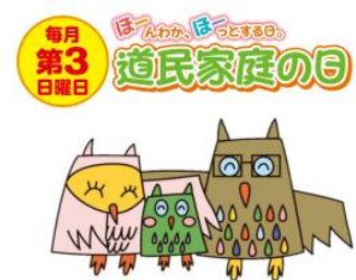
▲「道民家庭の日」キャラクター ふくろうのほーほーくん