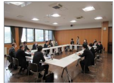
▲管内関係者による合同会議(檜山)