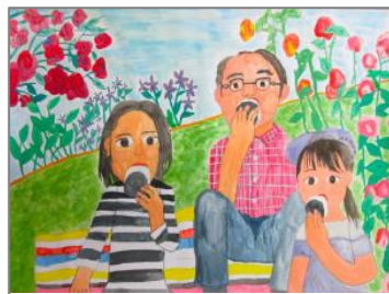
▲絵画コンクール2023最優秀賞(小学生)