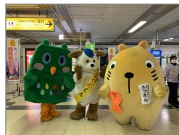
▲関係機関と啓発活動

北海道や学校関係者、情報通信企業等により構成する北海道青少年有害情報対策実行委員会などの一員として、インターネットや携帯電話による有害情報から青少年を守るため、各種啓発活動を進める。