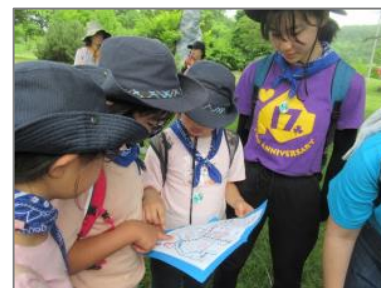
▲交流・体験活動事業