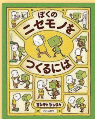
ぼくのニセモノをつくるには ヨシタケシンスケ(文) [ブロンズ新社]