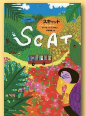
SCAT スカット カール・ハイアセン [理論社]