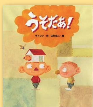
うそだあ! サトシン(作) 山村浩二(絵) [文溪堂]