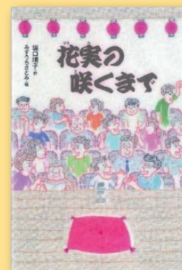
花実の咲くまで 堀口順子(作) みすうちさとみ(絵) [小峰書店]