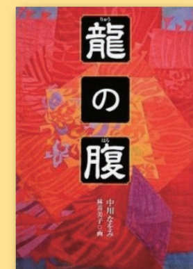
龍の腹 中川なをみ [くもん出版]