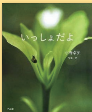
いっしょだよ 小寺卓矢(写真・文) [アリス館]