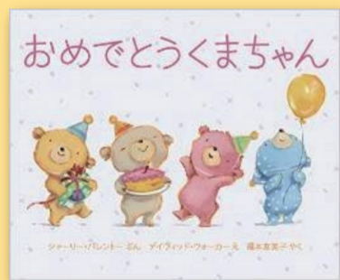
おめでとうくまちゃん シャーリー・パントレー(ぶん) デイヴィット・ウォーカー(え) [岩崎書店]