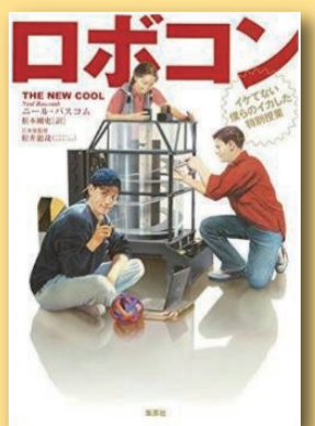
ロボコン イケてない僕らのイカした特別授業 ニール・バスコム(著) [集英社]