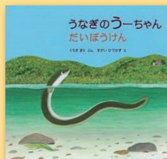
うなぎのうーちゃんだいぼうけん くろきまり(文) すがいひでかず(絵) [福音館書店]