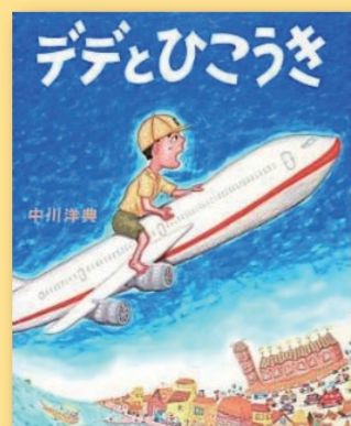
デデとひこうき 中川洋典 [文研出版]